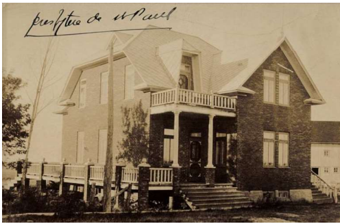
Presbytère de Saint-Paul-de-la-Croix

En 1869, cent quatre-vingt-douze (192) lots étaient concédés dont soixante-sept (67) habités par quatre-vingt-quatorze (94) familles. Érigée civilement en 1870, ce n'est que le 1 er janvier 1873 que Saint-Paul-de-la-Croix porte le nom de municipalité de la paroisse de Saint-Paul-de-la-Croix.