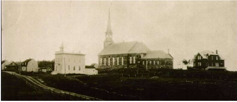
Église de Saint-Paul-de-la-Croix.