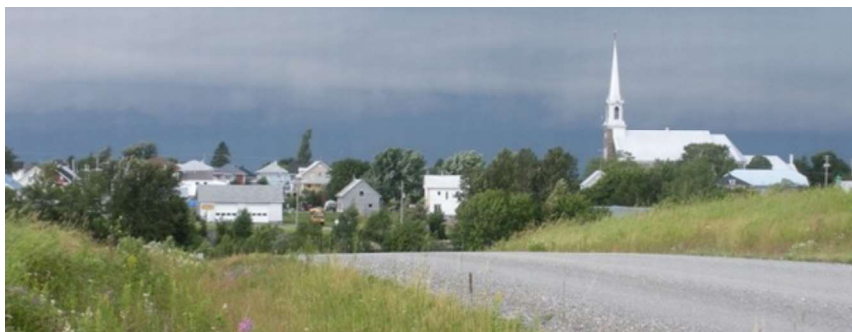
Une partie du village de Saint-Paul-de-la-Croix.

La première commission scolaire est formée en 1874; l'année suivante, deux institutrices sont engagées. Trois ans plus tard, on augmente à cinq le nombre des arrondissements scolaires. En 1915, s'ouvre une école bâtie sur le terrain de la Fabrique. L'école primaire, construite en 1952, est agrandie en 1967. Ces dernières années, une menace plane sur l'école primaire du village; la cause : le petit nombre d'élèves qui atteint difficilement le ratio de la commission scolaire pour garder une école ouverte.